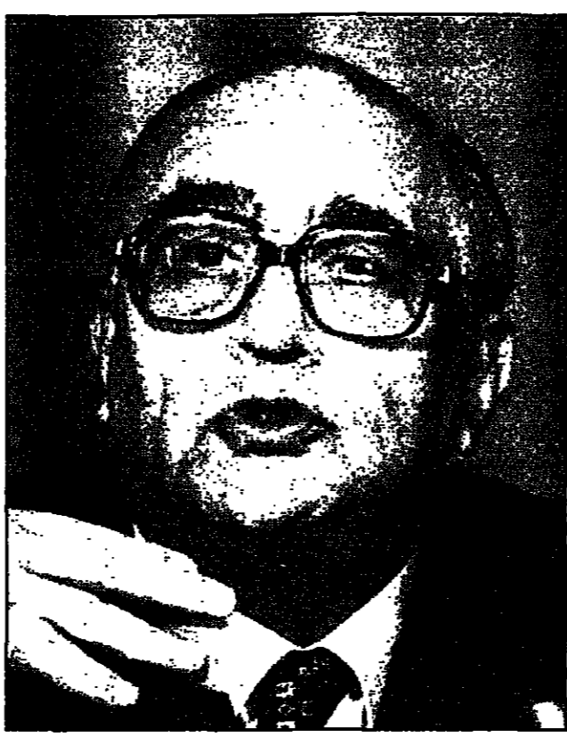
عبد السلام المجالي

طالب بكلمة بقطع التبليغ مع إسرائيل والعودة للحسن العربي مع إيقاف التبليغ للشركة. أما الوتر الثاني فتشتمل بترويج فكرة التحالف بين القوات الموحدية بين قوى المعارضة لمواجهة استمقاقات الانتخابات المقبلة. ورأى هذا الترويج نطقاً بخطر مركزي من تلخخ الإسلامي وهو الأمر الذي يشير نوايا التشكيك لدى قوى اليسار التي تتخذ من الإخوان لتعب بريقه أيدي المعارضة وتشغلها للحسين وتفرغها للتفاوض مع حكومة المجالي. ويعتقد الكثير من السياسيين هنا، وكذلك غالبية الحزبين الإسلاميين غير الأخرى لاستنكار استحقاقه الإسلامي عام 1993 في عهد حيدر يحيى برزني بايز. ففي تلك العام قررت المعارضة الحزبية على عدم تصحيح القوائم الانتخابية، إلا أن بعض السياسيين حين خروا أقدامهم من الشروط التي تعهدوا على تحقيقها في الحركة المناهضة لعيد الله الملكة.